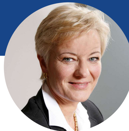
Інгрід Делтенре, генеральний директор Європейської мовної спілки

«Незалежні ЗМІ не лише слугують людям, вони є також наріжним каменем кожної економіки й демократії. І цей зв'язок є нерозривним. Якщо ЗМІ має не найкращу форму, то це лише відображає те, що політична, економічна ситуація та рівень демократії так само перебувають на неналежному рівні. Суспільне мовлення має бути рушієм з удосконалення цих систем».