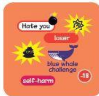
Exposure to harmful or disturbing content