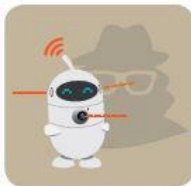
Privacy concern in connected toys